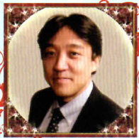
丹下 知浩 (テノール)